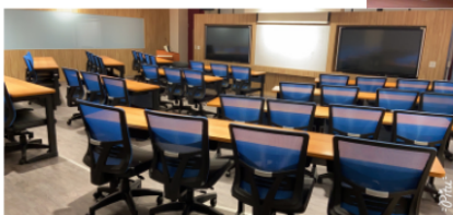
圖4-2. 企管系研究所專業教室2