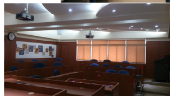
圖4-1. 企管系研究所專業教室1