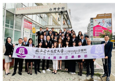
圖2. 113-駐烏蘭巴托台北貿易經濟代表處