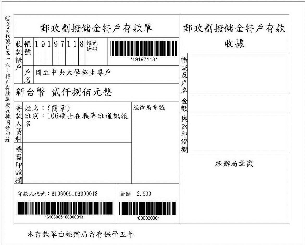
(表三) 郵局劃撥儲金特戶存款單